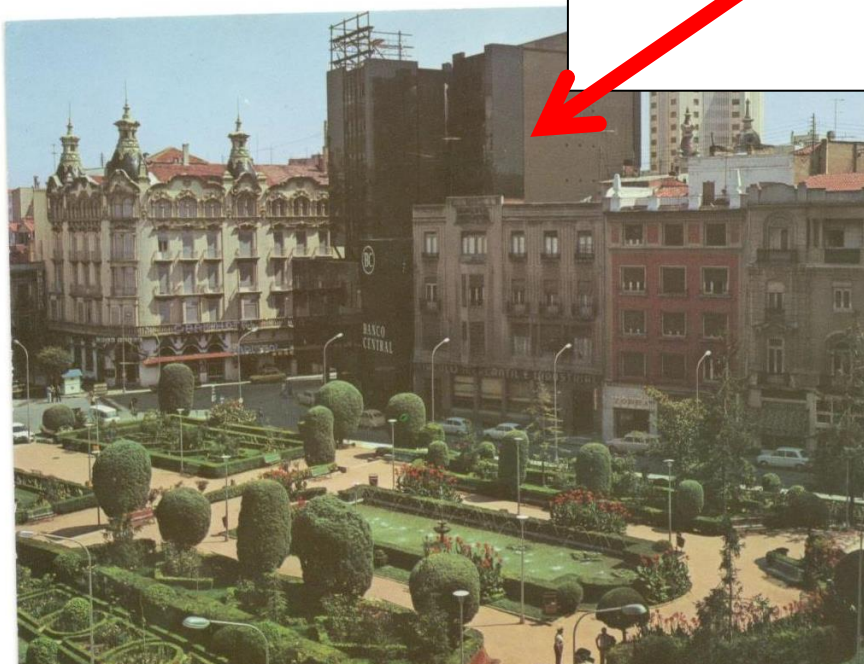
Imagen o parte frontal: tiene el diseño y tipo que se desee de una fotografía de un lugar a donde has viajado.