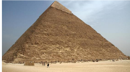
Pirámide de Guiza